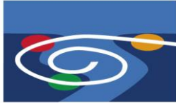
Bidasoa - Txingudi

Los triciclos son conducidos por personas voluntarias y acompañantes para cortar carreteras en los cruces y para asistir a los participantes... Estas personas están formadas en Balazta y Recycl'Arte.